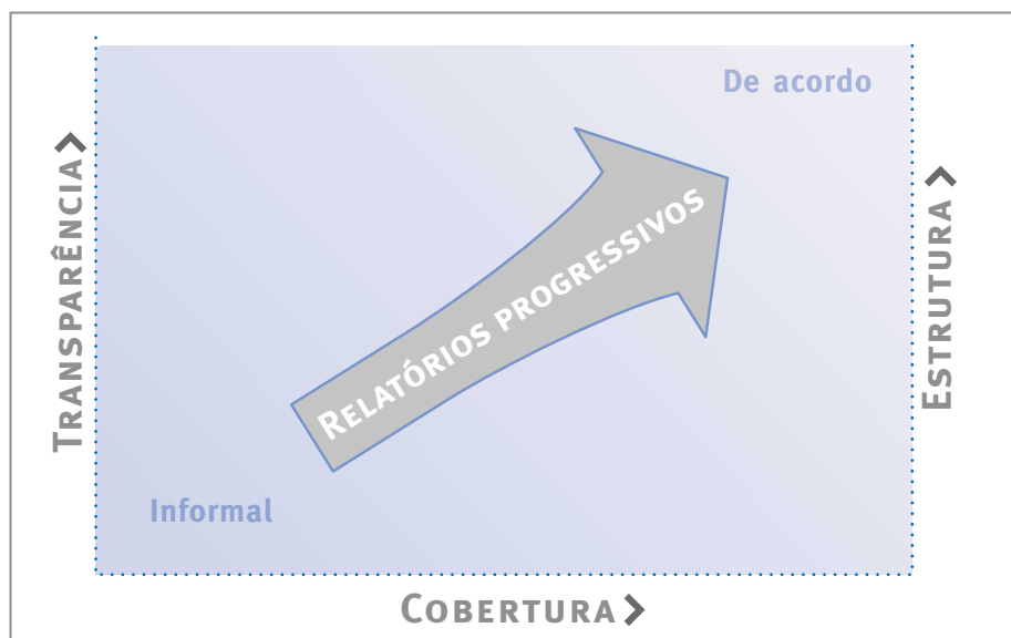
Figura 2. Opções para Relatórios